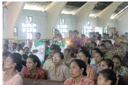
Gambar 1.2