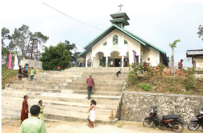
Sumber : (Dokumen penulis) Gambar 1.1